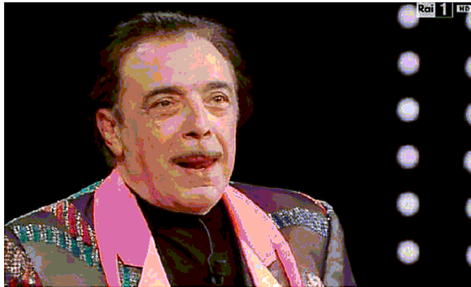
Nino Frassica e la sua band tra gli ospiti della manifestazione