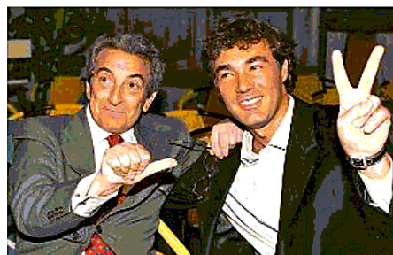
Settembre 1996: Michele Guardì (la sinistra) presenta Giletti, 34 anni, nuovo conduttore de "I fatti vostri", il programma leader di Raidue nella fascia di mezzogiorno