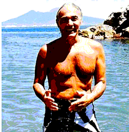
Massimo Giletti, 56 anni, al mare e, a destra, in un intenso primo piano. Il giornalista condurrà la serata conclusiva del premio letterario Caccuri, il 10 agosto

Massimo Giletti, classe '62, ha esordito come giornalista nel 1988 a "Mixer" e come conduttore tv negli anni '90 presentando su Rai 2 "Mattina in famiglia", "Mezzogiorno in famiglia" e "I fatti vostri". Dal 2002 al 2017 ha condotto "Casa Raiuno", dal 2004 al 2017 il domenicale "L'Arena". Nel 2017, dopo la soppressione de "L'Arena", ha lasciato la Rai e passa a LA7 dove conduce "Non è L'Arena"