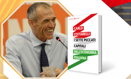
CARLO COTTARELLI I SETTE PECCATI CAPITALI DELL'ECONOMIA ITALIANA