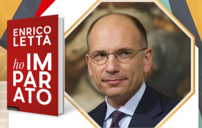
ENRICO LETTA HO IMPARATO